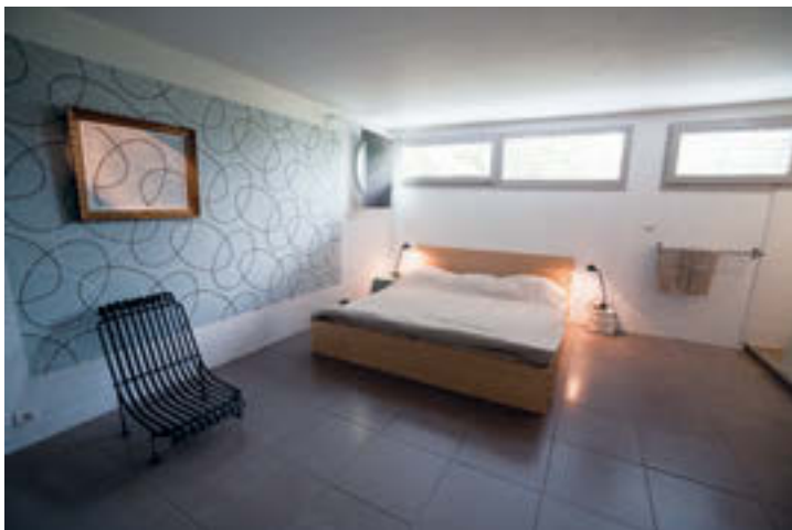
La chambre parentale se trouve au niveau de la pièce de vie principale et profite d'une très belle salle de bains au sein du même espace. En fond de volume, un bandeau horizontal et un hublot assurent les entrées de lumière.