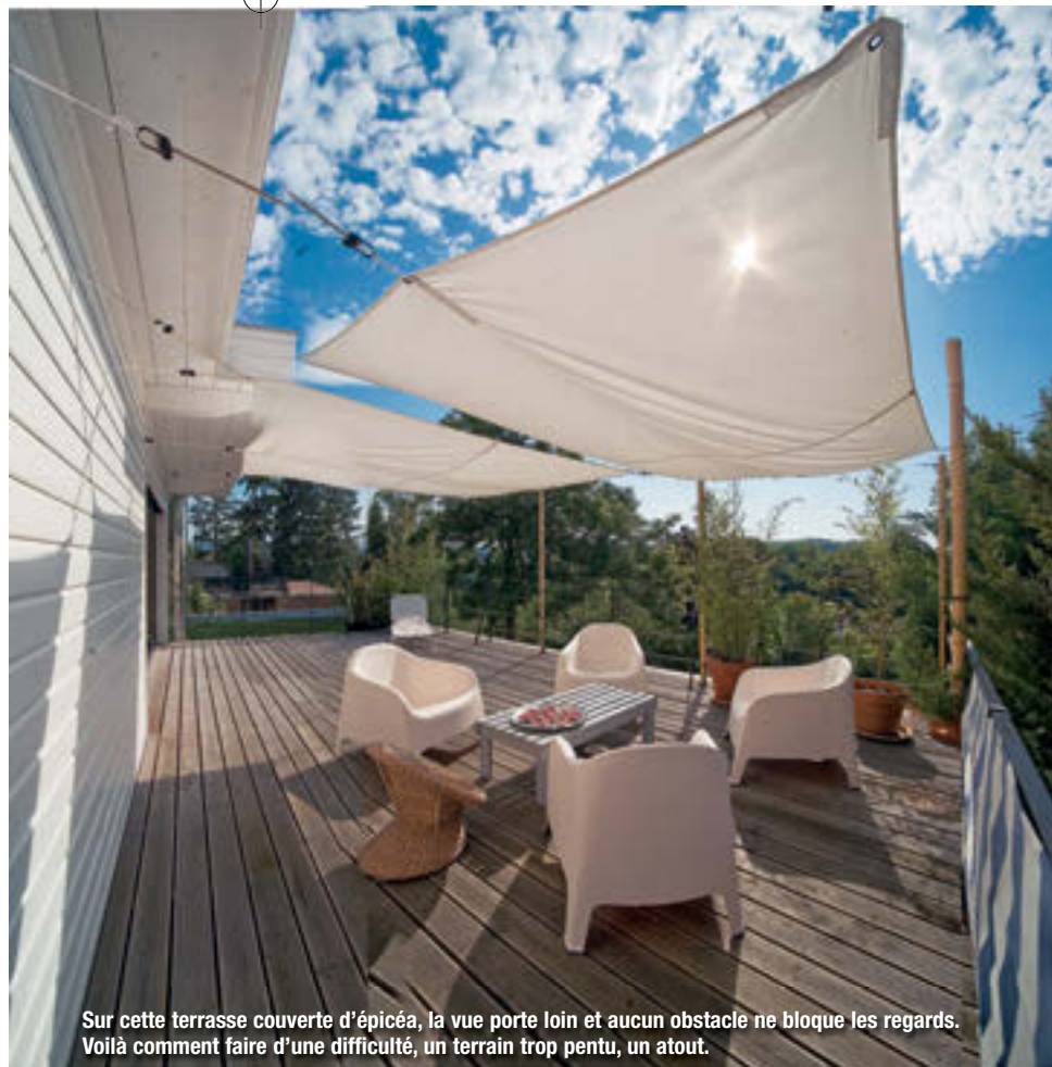
Sur cette terrasse couverte d'épicéa, la vue porte loin et aucun obstacle ne bloque les regards. Voilà comment faire d'une difficulté, un terrain trop pentu, un atout.