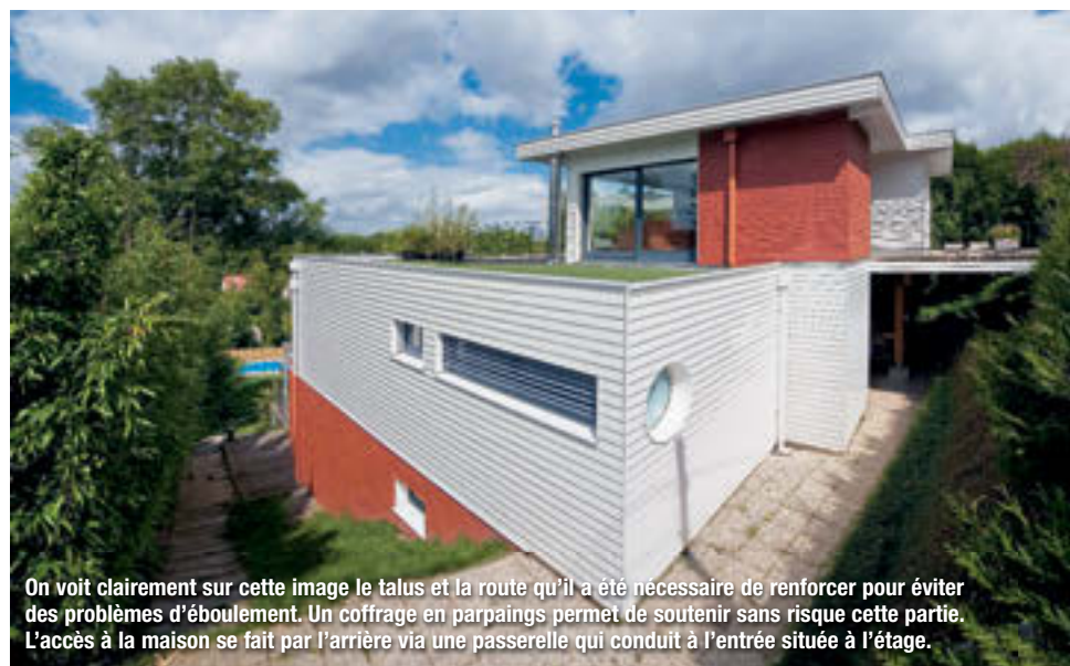
On voit clairement sur cette image le talus et la route qu'il a été nécessaire de renforcer pour éviter des problèmes d'éboulement. Un coffrage en parpaings permet de soutenir sans risque cette partie. L'accès à la maison se fait par l'arrière via une passerelle qui conduit à l'entrée située à l'étage.