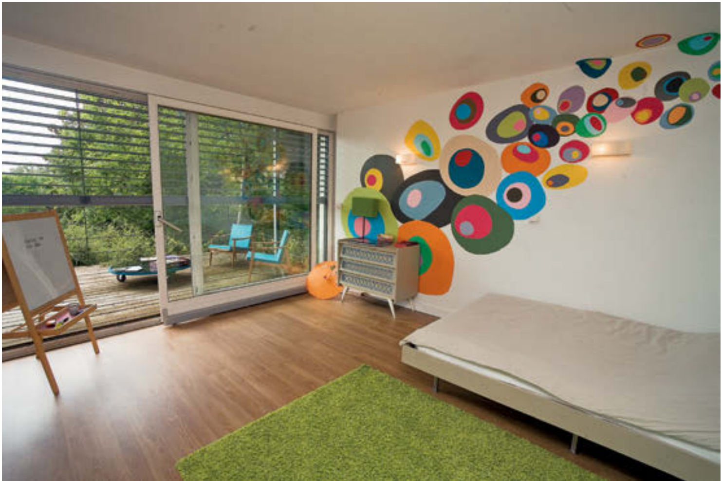
Les espaces des enfants profitent du « rez-de-chaussée » et s'ouvrent sur le paysage. Ici comme partout ailleurs, le mobilier n'encombre pas les lieux.